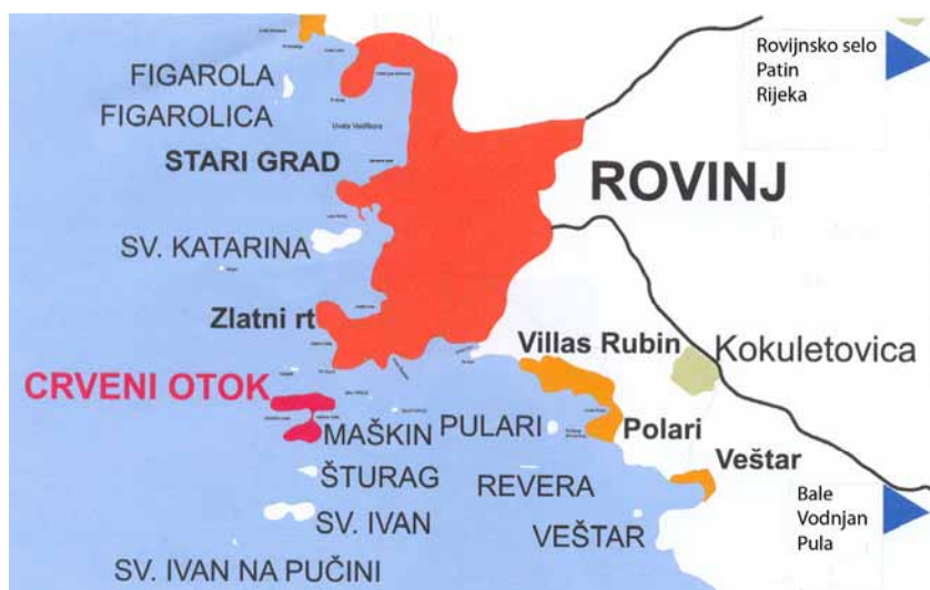
Otoci oko Rovinja i položaj Crvenog otoka

Oduševljen rovinjskim arhipelagom, Georg Hütterott, uspješni poduzetnik iz Trsta, 1891. kupio je njegove južne otoke: Sv. Andriju, Maškin, Šturag i Sv. Ivana. Poslije je kupio i veliki posjed na kopnu, južno od grada. Samostan je preuredio u obiteljs-