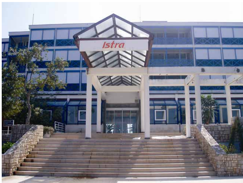
Ulaz u stari hotel

Novi je vlasnik započeo temeljitu rekonstrukciju svih smještajnih kapaciteta u njegovom vlasništvu, a prvi je na redu bio hotel Istra na Crvenom otoku. Krajem 2005. zaključen je ugovor s izvođačem o temeljitoj rekonstrukciji po sustavu "ključ u ruke", a ugovorena je vrijednost radova bila 150 milijuna kuna (20,66 milijuna eura), bez opreme, što je nesumnjivo jedno od najvećih ovogodišnjih ulaganja u turističke kapacitete na sjevernome Jadranu. Cilj je bio ostvariti nužne uvjete za podizanje kategorije hotela s tri na četiri zvjezdice u ukupno 236 soba, 14 apartmana i 38 obiteljskih soba. Neto ploština hotela je 18.990 m 2 , a građevne čestice 19.892 m 2 . Hotel je i prije i sada namijenjen obiteljskom turizmu, što znači da treba pružati usluge smještaja, prehrane, športske i wellness sadržaje te razne uslužne djelatnosti (trgovačke, ugostiteljske,