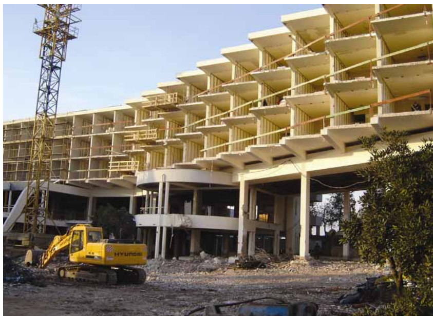
Gradilište na početku radova

cijela je površina izravnana. Uveden je cjeloviti sklop vodenih atrakcija i sunčališta koji je povezan s obližnjom plažom.