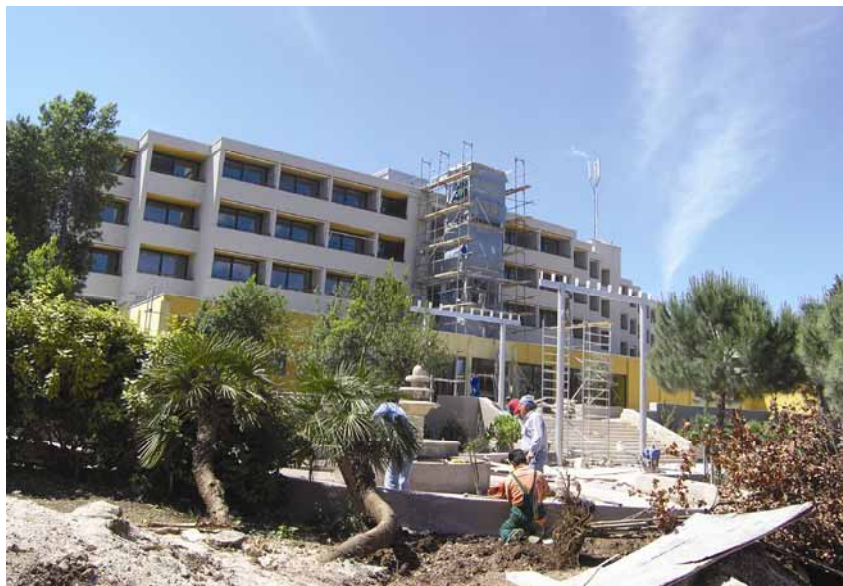
Radovi ispred glavnog pročelja tijekom posjeta gradilištu

kovima koji su precizno utvrđeni u ugovoru. Najprije je predan treći kat (24. travnja), potom drugi (30. travnja) i prvi kat (8. svibnja), a na kraju sobe u visokom prizemlju (16. svibnja). S-krivulja se potvrdila kao dobar indikator stanja, trenda i prognoza izvršenja te podloga za donošenje odluka. Za smještajni je dio hotela izrađen operativni plan prema taktovima i svaka je smještajna jedinica imala operativni plan izvršenja po jednom danu.