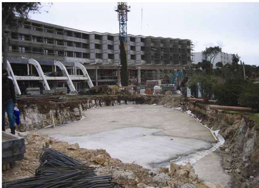
Gradnja novog bazena