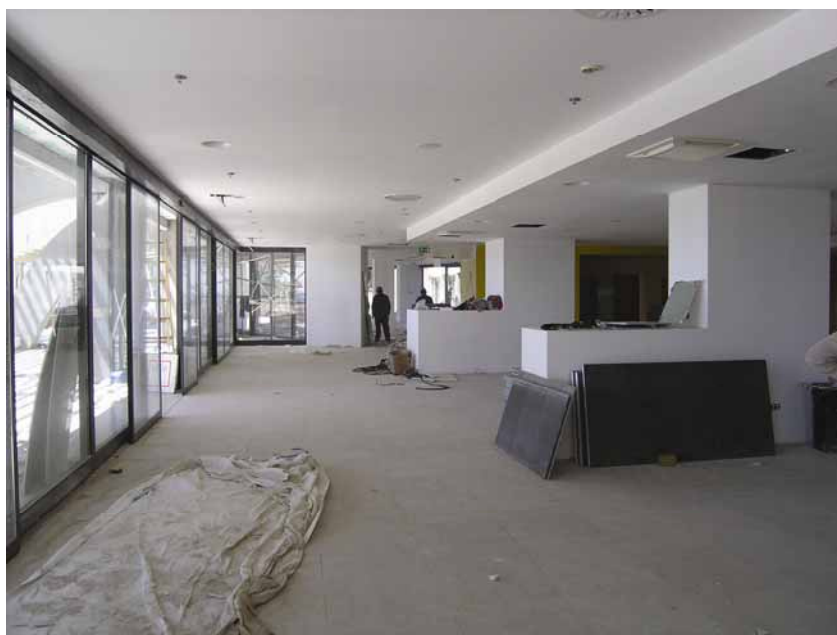
Uređivanje hotelskog predvorja

S prof. Radujkovićem obišli smo cijelo gradilište. Radovi su se izvodili samo u prizemlju i na prostorima ispred hotela, budući da su katovi s hotelskim sobama već prije predani investitorima. Obišli smo i gradilište wellness centra na krajnjem zapadnome kraju hotela, ali taj dio ipak ne treba biti završen do 17. lipnja kada u hotel stižu prvi gosti. Dogovoreno je da se posebno ogradi i da se potom