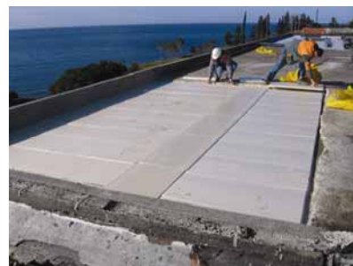
Radovi na krovu hotela

Zgrada se sastoji od 7 višekatnih dilatacija, od kojih su četiri u najstarijem dijelu hotela, a preostale tri u dijelu hotela izgrađenom 1986. Uz glavni hotelski kompleks pridodano je više jednokatnih i dvokatnih prigradnji, uglavnom armiranobetonskih, iako ima i nekoliko kamenih građevina veće starosti. Mnoge će od tih prigradnji biti uklonjene. U detaljnoj adaptaciji i rekonstrukciji hotela predviđaju su manja rušenja i dogradnje u niskom i visokom prizemlju bez mijenjanja izvornih dilatacija i zbog toga će prema projektu kon-