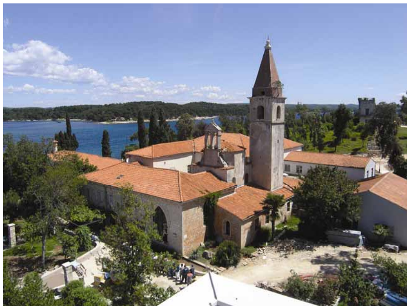
Preuređeni samostanski kompleks

ki ljetnikovac, a na Maškinu je izgradio obiteljsku grobnicu. Uredio je i park u koji je zasadio biljke iz cijelog svijeta. Ljetnikovac je opremljen brojnim umjetninama, a postao je i omiljeno boravište uglednih plemićkih obitelji. Zabilježeno je da je u njemu 1910. boravio i prijestolonasljednik Franz Ferdinand, pa se stoga boravak obitelji Hütterott u Rovinju