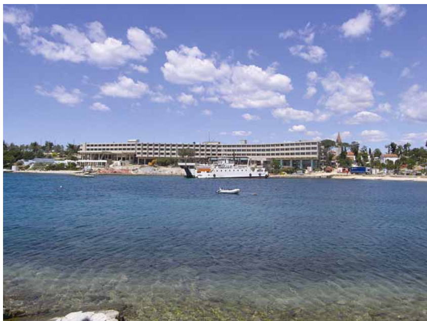
Gradilište hotela snimljeno s Maškina

Za tvrtku je ovo bio velik izazov. I ubuduće planiraju prihvaćati slične izazovne poslove i zato su ovo iskustvo temeljito prostudirali. Nakon završetka radova na zaključnoj je analizi svega što je obavljeno i što valjalo popraviti bilo nazočno više od 70 stručnih djelatnika poduzeća te se pokazalo da se unatoč složenosti projekta i kratkoće roka za realizaciju u specifičnim uvjetima otoka, projekt realizirao u predviđenom roku, a hotel je primio prve goste kako je planirano.